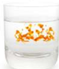
Perla de CoQ10 Estándar

Ubiquinol QH de VByotics® es de origen 100% natural obtenido por fermentación microbiana CoQsource® que utiliza el sistema de entrega VESIsorb® basado en la formación de un nano-colloide por auto-ensamblado natural que deposita el Ubiquinol QH imitando el proceso fisiológico natural del cuerpo humano y por tanto incrementando de forma espectacular la absorción y la biodisponibilidad del CoQsource® Ubiquinol QH.